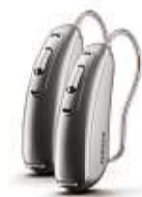
Phonak Audéo™ B-Direct