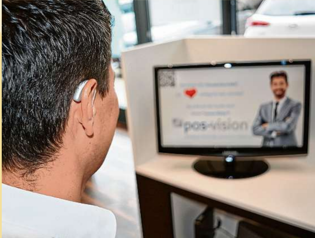
Pünktlich zum zehnjährigen Bestehen glänzt Hörtec Hörsysteme mit einer Hörgeräte-Weltneuheit.

Phonak schließt mit seinem neu entwickelten Hörgerät eine Lücke. Das Phonak Audéo B-Direct wurde als umfassende Hörlösung für fast alle bluetoothfähigen Mobiltelefone entwickelt und bietet allen Hörgerätenutzern neue Möglichkeiten. Vier von fünf Smartphone-Käufer entscheiden sich weltweit für das Betriebssystem Android. Phonak Audéo B-Direct ist auf dieses zugeschnitten, ebenso bietet es aber Kompatibilität mit dem iPhone von Apple und anderen Telefonen. Das neue Hörgerät verspricht laut Hersteller neben hervorragender Tonqualität neuste und branchenweit einzigartige Technologie. Der von Pho-